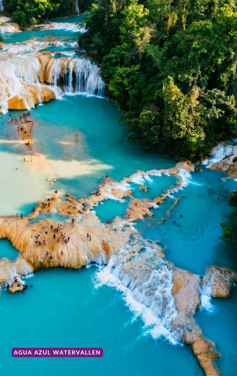
AGUA AZUL WATERVALLEN