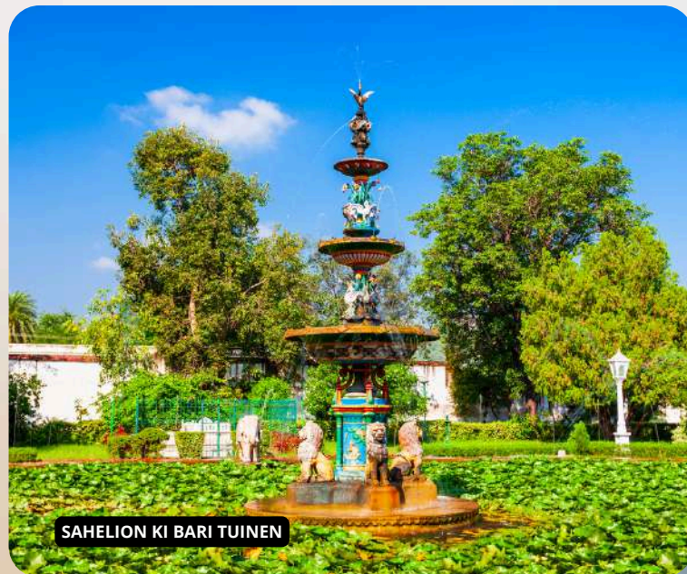
SAHELION KI BARI TUINEN