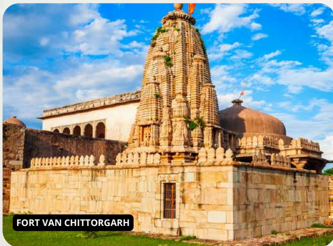
FORT VAN CHITTORGARH